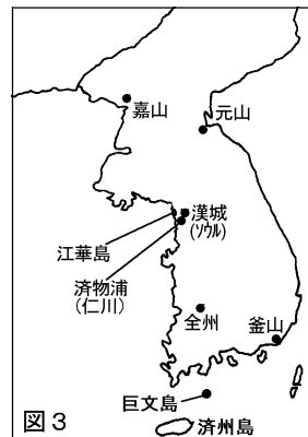
図3 正解 ホ、釜山[元山、仁川]

設問12 明治維新政府は、鎖国政策をとる朝鮮に開国を要求し、1875年軍艦「雲揚号」による「江華島事件」を誘発させ、翌年、閔氏政権との間に「日朝修好条規」を締結した。この条約は朝鮮の中国からの独立、群山など3港の開港、公使館・領事館の設置、在留日本人の治外法権などを含む不平等条約で、日本の朝鮮進出の足掛かりとなった。